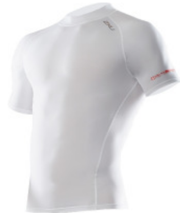
2XU Compression Top

2XU hat Compression-Oberteile, -Tights, -Shorts, -Socks und -Calf-Guards im Sortiment. Das 2XU Compression-Infodokument sowie Bildmaterial erhalten Sie beim Pressekontakt.