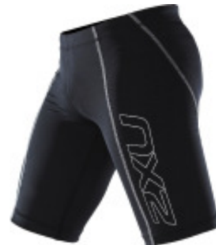
2XU Compression Shorts