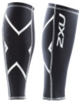
2XU Compression Calf Guards